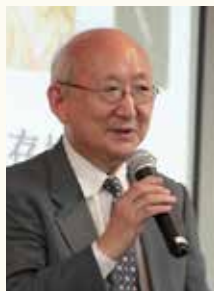
河合 正朝 慶應義塾大学 名誉教授